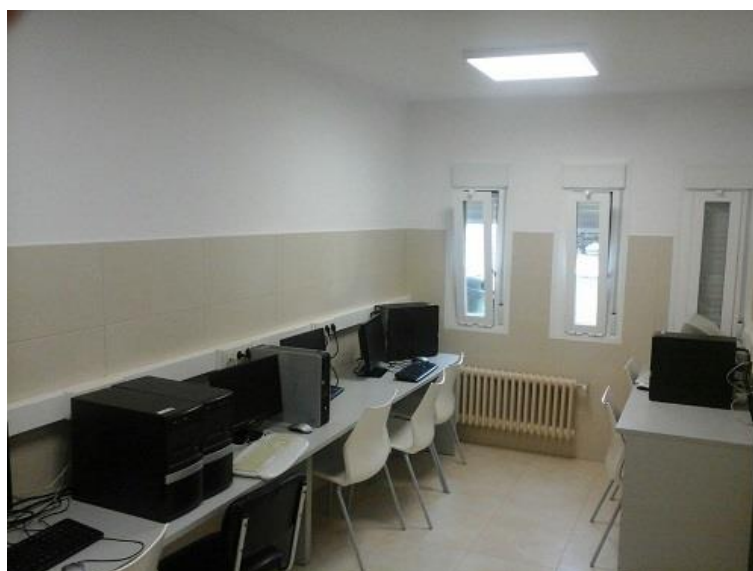
Aulas en la EFA Boalares (Ejea de los Caballeros)